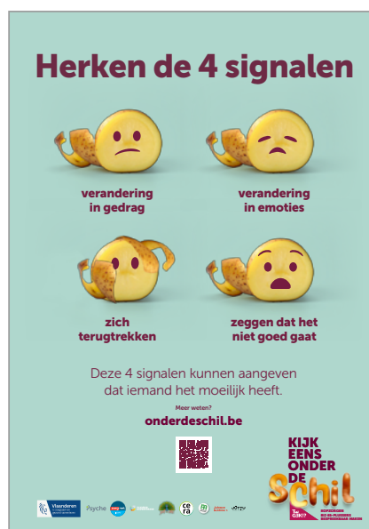
Affiche 2 – Signaalherkenning: deze affiche sluit aan bij de affiche rond signaalherkenning