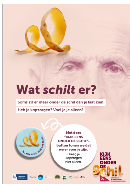
Affiche 3 – Op deze affiche staat onze button centraal. Wie deze button draagt, laat zien er te zijn voor 65-plussers die willen praten over hun psychisch (on)welbevinden. Deze button zal aangeboden worden in zorgcontexten en daarbuiten.