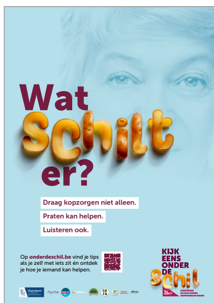
Affiche 1 – Algemene campagneboodschap met als doelgroep 65-plussers en hun nabije omgeving